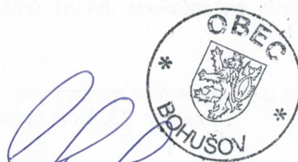
..... za vypůjčitele