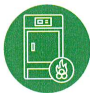
KOTEL NA BIOMASU